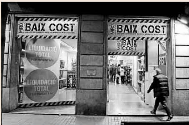
Establiments Miró tiene 80 tiendas y emplea a 566 trabajadores.

Fuera del proceso habría quedado la cadena portuguesa Worten, controlada por el grupo Sonae. La enseña participó activamente en el proceso de due diligence pero, según las mismas fuentes, solo esta-