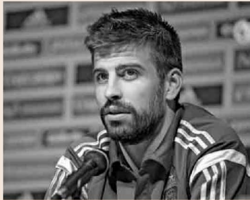
Gerard Piqué es el primer accionista de la compañía que se creó en noviembre de 2011.

"Es el primer juego y la idea es ir lanzando más en el futuro", asegura el consejero delegado, Alberto Guerrero. El producto está en 15 idiomas y disponible en fase beta y durante el Mundial preveía lanzar las aplicaciones para iOS y Android. La empresa